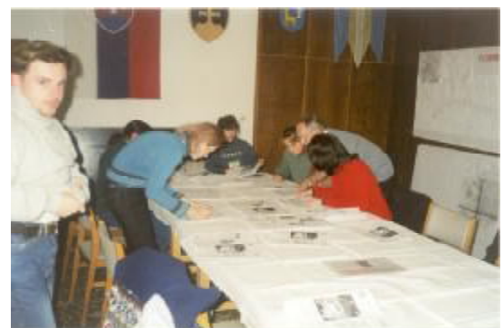
Práca redakčnej rady...