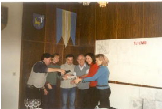
Uvítanie do života 1. čísla...

Členov komisii pre voľby, respektívne pre referendum delegujú politické strany, ktoré majú zastúpenie v slovenskom parlamente alebo v obecnom zastupiteľstve. Vyplýva to zo zákona.