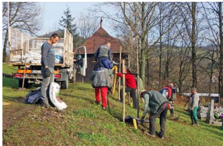
Sadenie stromčekov na cintoríne

rávania) a je obava, že sa realizácia projektu nestihne do plánovaného zazmluvneného termínu ukončenia akcie, teda do 16. 5. 2020. V takom prípade by nám Eurofond neuhradil financie za práce a museli by sme to zaplatiť z vlastných peňazí, čo by bolo na pomery nášho obecného rozpočtu nereálne resp. likvidačné. Treba to zvážiť.