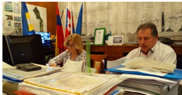
Dve fotografie z rokovania obecného zastupiteľstva na konci roka – 16. decembra 2019