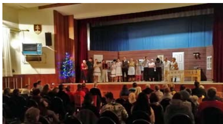
Ešte v starom roku, 28. 12. 2019 nám prišli predviesť svoje umenie dvadelníci z Chlebníc s hrou Aká bolesť taká medicína .