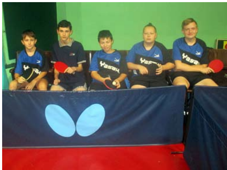
Tabuľka 4. ligu východ

štatovať, že im táto súťaž je už naozaj kvalitná. Hrajú v nej stolnotenisové mužstvá zo 6-ich okresov. Súťaž sa skončila predčasne kvôli koronavírusu a to 20-tym kolom, teda 2 stretnutia