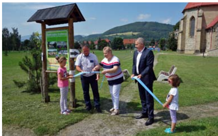
Slávnostné odovzdanie relaxačného parku pri kostole, za účasti zástupcov sponzora – Prvej stavebnej sporiteľne.