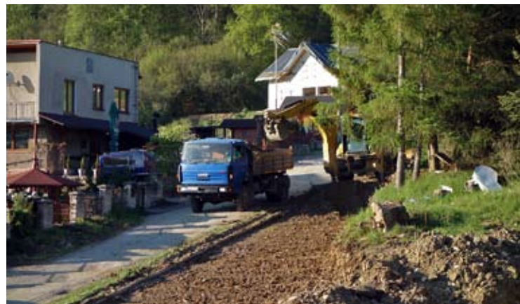
Úpravy na podporu individuálnej výstavby a úpravy miestnych ciest.