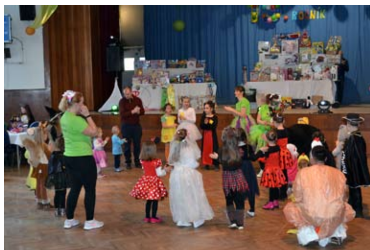
Mladé rodiny s Babincom, hasičmi a ďalšími pomocníkmi zorganizovali ďalší ročník maškarného plesu pre deti i dospelých 15. 2. 2020.