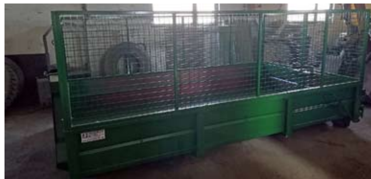
Zariadenia na obrázkoch: vľavo hore snežný šípový pluh, pod ním mulčovač, vpravo hore kosačka, pod ňou kontajnerová vlečka.