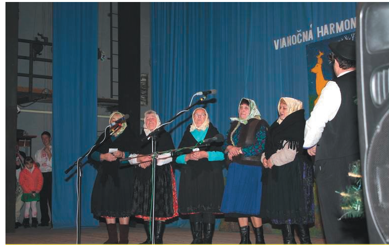
Dôchodcovia sa predstavili štedrovečernými koledami