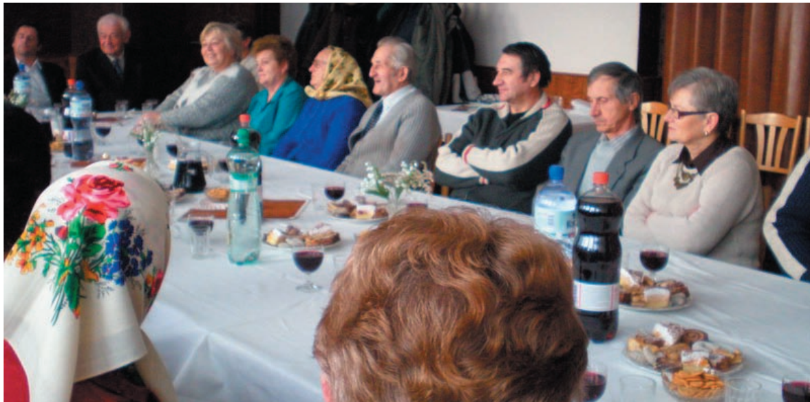
Čiastočný pohľad na účastníkov rokovania