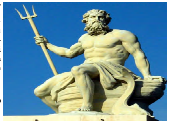
Poseidón- vládca morí