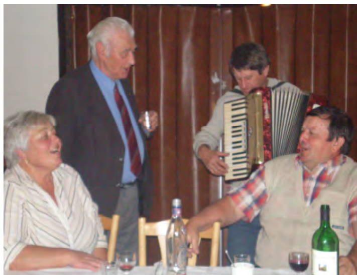
Pri harmonike si spoločne zaspievali