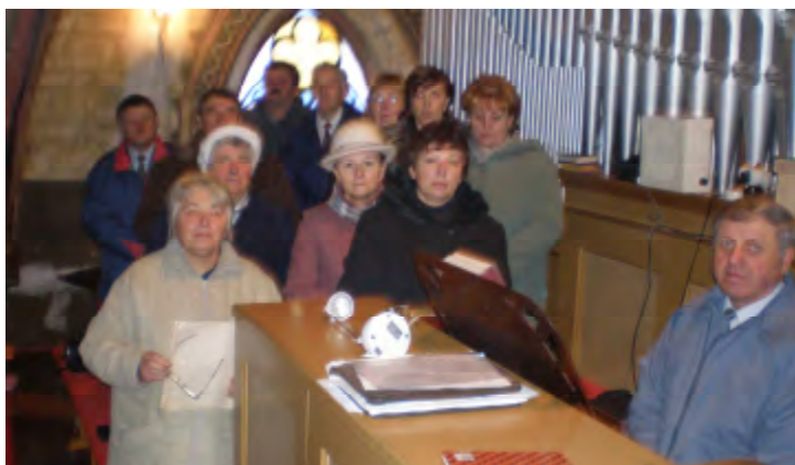
Členovia zboru prítomní na nácvičku