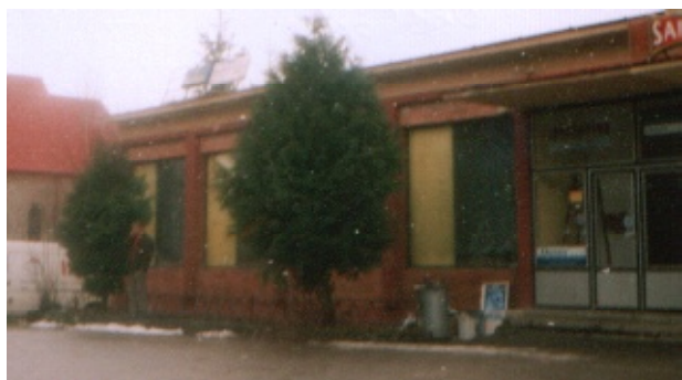
Zrenovaná predajňa potravín