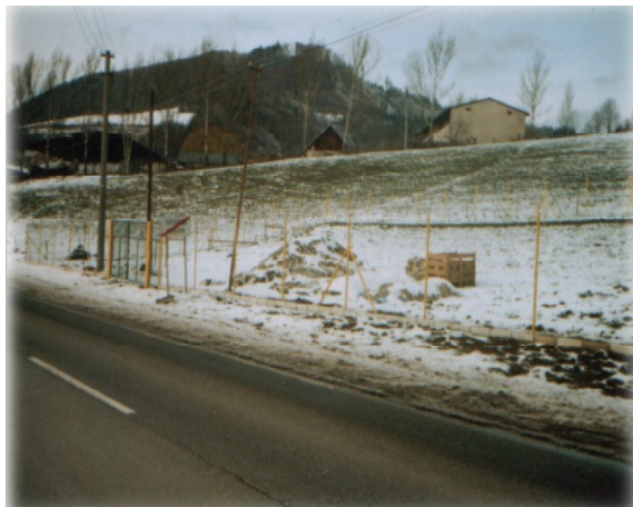
Prípravné práce pre záhradné centrum