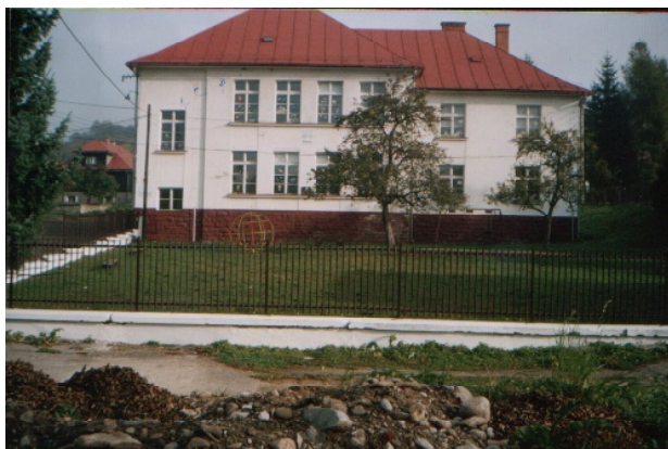
Pohľad na upravený priestor okolo ZŠ a MŠ

- Vidím to tak, pokiaľ spoluobčania sami nebudú dôsledne, bez obáv, poukazovať na nedisciplinovaných občanov, tak sa to rýchlo nezlepší. Starosta sám s poslancami nedokáže ustriechnuť niektorých jedincov (nemáme na to políciu, ako je to v mestách). Každý občan by mal na znečisťovateľov upozorňovať a poukazovať a keď treba, tak aj dosvedčiť komisii verejného poriadku. Takouto nevšímavosťou ľudia prichádzajú o vlastné peniaze, ktoré musia dať obci vo forme poplatkov za odpad a na vyrúbené pokuty, ktoré obec musí platiť (za nepovolené skládky) úradu životného prostredia.