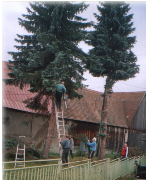
Spilovanie stromov v obecnom parku