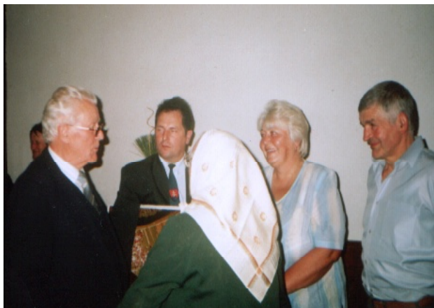
V priateľskom rozhovore so svojimi blízkymi a starostom