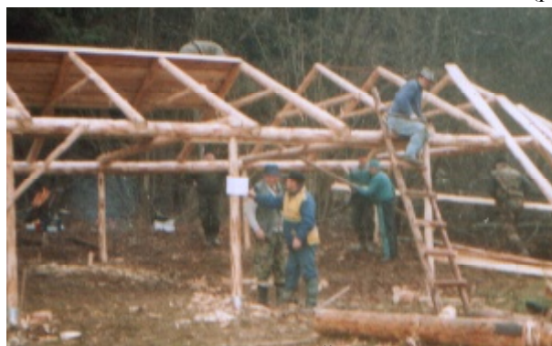
S nadšením stavali altánok na Črtáži