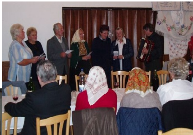
Piesne venovali svojmu vzácnemu rodákovi