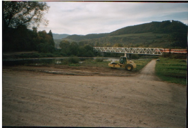
Úpravy okolo rieky Oravy ešte stále pretrvávajú