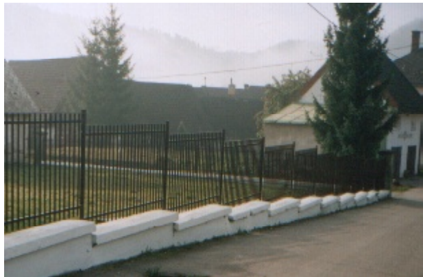
Čisté priestranstvo je ozdobou obce