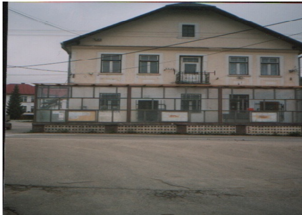
Nový prístrešok na urbárskej budove